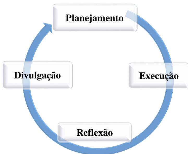
Figura 3. Processo de Avaliação Institucional Interna em cada dimensão.

O processo de avaliação institucional interna para cada uma das dimensões será organizado nas seguintes fases, conforme Figura 3.