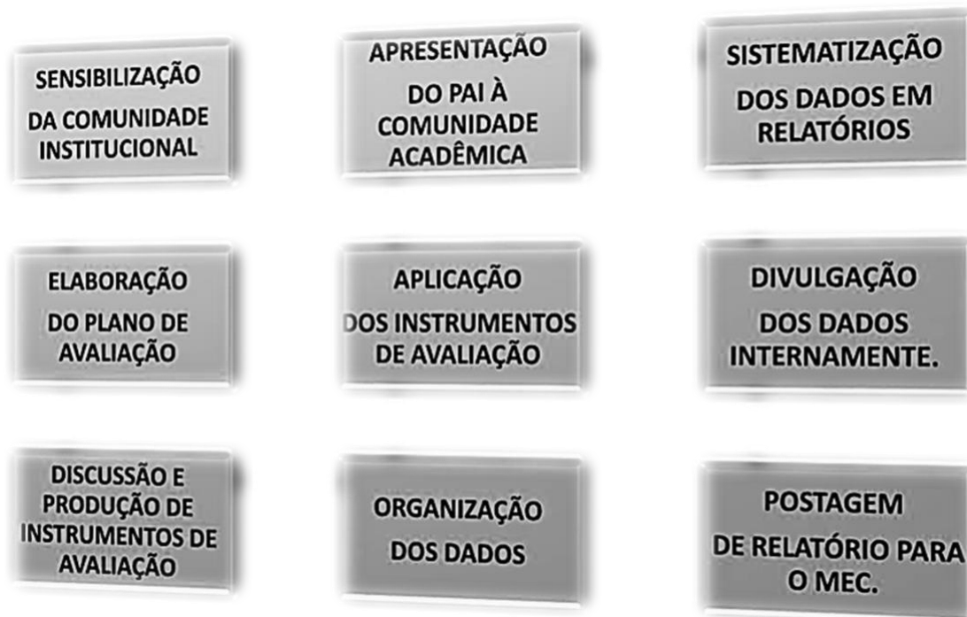
Figura 2. Procedimentos para sensibilização da comunidade institucional.

impressões sobre a faculdade. Dessa maneira, serão importantes os seguintes procedimentos, conforme Figura 2